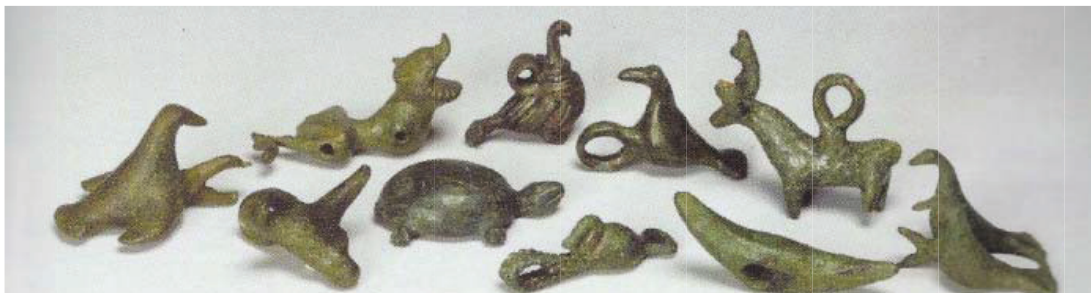
Рис. 3. Цветная вклейка. [9, с. 128-129]

да люди знают не только повадки, но и язык животных, благодаря чему становится возможным одомашнивание последних. Нельзя не обратить внимание и на то, что вновь, так же, как и в случае с образом индюка, мы имеем дело с поздней трансформацией, поскольку обезьяна представляет собой вид экзотического, «заморского» животного, используемого для расширения культурных рамок танца до вселенских масштабов, придания им универсального характера. Заслуживает упоминания и сам заимствованный характер ряженого – обезьяны не водились в местной природе. Но эта экзотичность и инородность лишь подчеркивают его «потустороннее» происхождение, трактуя его как элемент энтропии, регулирующий вторжение хаоса в пространство культуры.