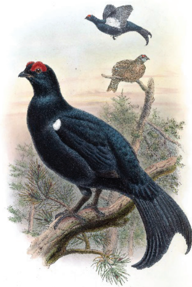
Рис. 2. Кавказский тетерев

К счастью, помимо книжных описаний до нас дошла и телевизионная запись танца, аутентичность исполнения которой не вызывает никаких сомнений. Документальные кадры запечатлели для нас одно из выступлений фольклорно-этнографического ансамбля «Хъуыбады», участники которого выросли в живой традиции и сохраняли ее дух до тех пор, пока это было возможно. Солист – известный в республике танцор и хореограф Василий (Уагка) Джатиев [7]. Одной из характерных примет этой записи следует считать фигуру ряженого, представленного образом обезьяны (маймули), мешающего исполнению танца и в конце падающего к ногам танцоров. В этом приеме можно видеть характерный элемент традиционного новогоднего колядования, когда ряженный «умирал» и оставался лежать на земле до тех пор, пока хозяева не одаривали своих гостей угощением. Получив исковое вознаграждение, ряженный вновь воскресал, знаменуя, по всей видимости, новогоднее обновление мира [8, с. 485]. Вовсе не случайно он оказался участником танца Гогыз , поскольку и здесь мы наблюдаем ясную соотнесенность с эпохой первотворения, когда еще нет непреходимой границы между людьми и животными, ког-