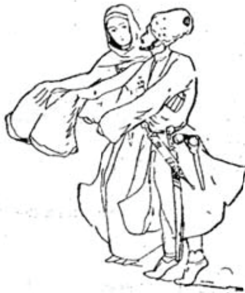
Рис. 1. Танец «Индейка» (Гогыз). Зарисовка М.С. Туганова

Согласно описанию М.С. Туганова, который также приводит и рисунок его наиболее характерного движения, танец носил шуточный характер и был призван развеселить собравшихся и снять напряжение, которое там неизбежно возникало из-за осознания той высокой ответственности, которая ложилась на плечи участников общественных танцев, ведь каждое их движение становилось предметом тщательного рассмотрения и последующего обсуждения. Вероятно, этим веселым, карнавальным характером следует объяснить и его популярность, что и стало причиной, по которой на него обратил внимание М.С. Туганов и включил его в перечень описанных им танцев и даже сделал зарисовку наиболее характерного движения [2, с. 83–84]. Все же, несмотря на откровенно шуточный характер, изучение мифологического аспекта этого танца позволяет пролить свет на общие вопросы функции, семантики и происхождения осетинской хореографии в целом, которые и будут в центре внимания настоящей статьи.