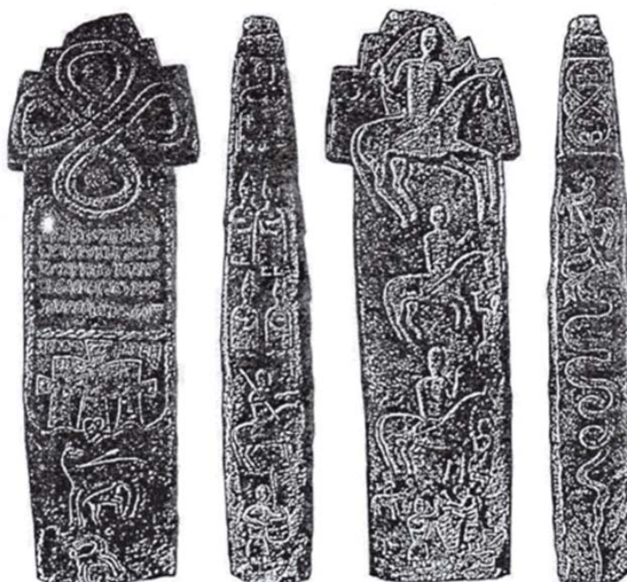
Илл. 2. «Эльхотовский крест» (по В.Ф. Миллер, 1893; Н.А. Охонько, 1994)

Словарь «Этнографии и мифологии осетин» отразил смысл термина «Татартуп» следующим образом: «Татартуппыдзуар – (буквально «святой Татартуп») – в осетинской мифологии покровитель равнинной Осетии и Кабарды. Одновременно и аграрное божество, почитаемое всеми осетинами... По предположению осетин, Татартуппыдзуар способствовал получению хороших урожаев хлеба не только в равнинной, но и в горной Осетии, где