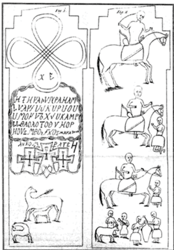
Илл. 3. Изображение на «Камбилеевском кресте» (по И.А. Гильденштедт, 1787)

Северного Кавказа под именем «Татартуппидзуар» был не Татартупский минарет и скрытые рядом с ним под землей фундаменты мечети XIV века, как утверждает процитированное выше уважаемое издание, а святилище, располагавшееся на вершине горы, над Татартупским минаретом, среди развалин города Джулат/Татартуп, на которое позднее перешло его наименование. Как называлась, собственно, эта мечеть и каким святым были посвящены церкви города – нам пока неизвестно.