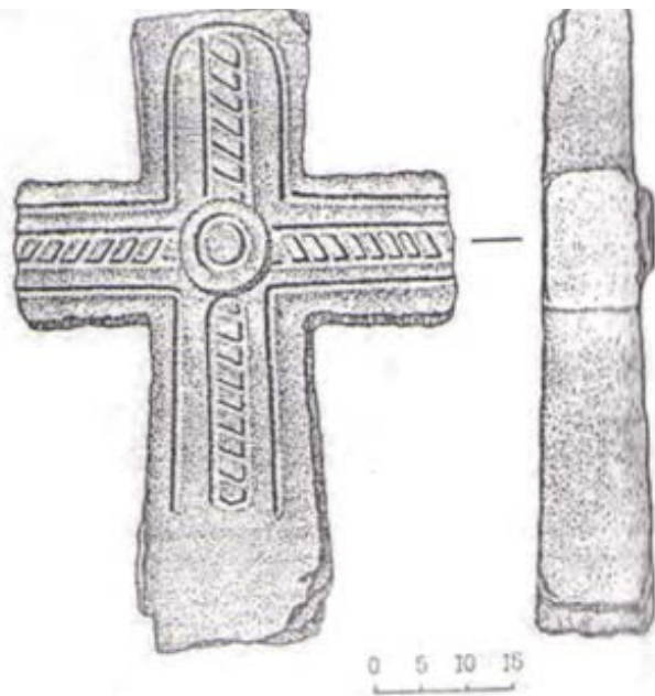
Илл. 4. «Змейский крест» (по С.Н. Малахов, Р.Ф. Фидаров, 2017)

А.С. Пушкин тонко понял особенность священного места Татартуп и сделал это зачином своей неоконченной поэмы. Действительно, любые враждебные действия, тем более убийство, являлись