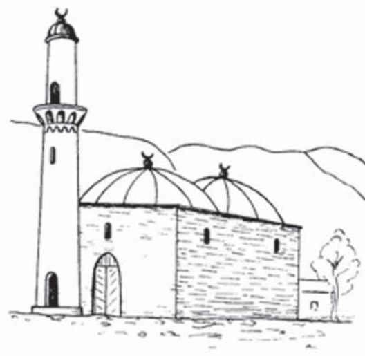
Илл. 1. План и реконструкция малой (магальной) мечети Верхнего Джулата / Татартупа (по В.А. Кузнецов, 2003)

этом же районе, напротив Джулата, у современного селения Эльхотово был найден так называемый «Эльхотовский крест» [27; 31]. Памятник представляет собой массивную, прямоугольную в сечении каменную стелу, верхняя часть которой оканчивается короткими широкими выступами, образующими крест. Все четыре плоские стороны креста покрыты резными изображениями, выполненными довольно искусно (илл. 2) [27; 31, с. 7, рис. 2]. Срединная зона лицевой части креста снабжена резной, обрамленной рамкой надписью греческими буквами, которую И.Н. Помяловский, а за ним и В.Ф. Миллер читают так: «... до второго пришествия ... Господа нашего ... Христа покоится раб божий Георгий» [27; с. 127; 31, с. 7].