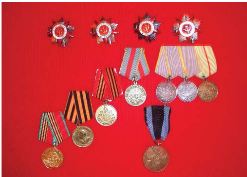
Боевые награды отца

какой есть. В результате получился поздравительный адрес бесценный. Некоторые, не зная точного места жительства отца, отправили подписанный адрес и свое письмо на имя других однополчан и с надеждой на эстафету, которая доставит их письма до адресата. Надо было видеть глаза отца, когда он разбирал эту «почту».