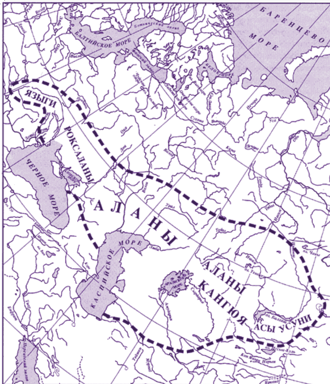
Рис. 3. Сармато-аланская этносфера (в границах «северной арийской империи» I–сер. IV вв. н. э.) по Н.Н. Лысенко

делить следующие отдельные группы аланов: