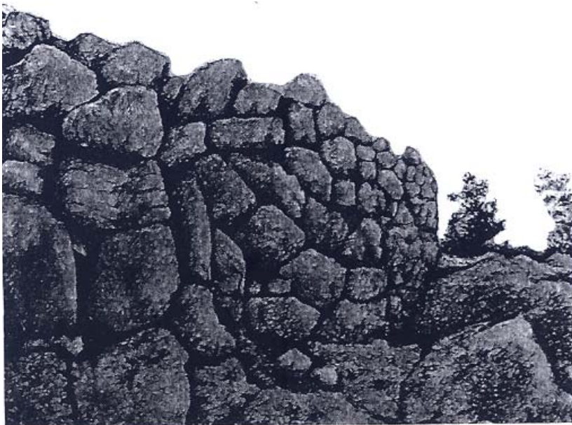
Часть северо-восточной стены Зылды Мæсыг

Во время проведения археологических экспедиций Юго-Осетинского НИИ нам удалось побывать на плато Зылд и осмотреть крепость «Зылды мæсыг». Конечно, это не «мæсыг» – башня, но такое название за ним закрепилось. Кроме «Зылды мæсыг», нам удалось зафиксировать еще один памятник, напоминающий «Зылды мæсыг». Это небольшая стена, сложенная из россыпей камня близ с. Брытатаг в местности «Уарийы сæрмæ». Возможно, это результат строительства крепости, по какой-то причине не за-