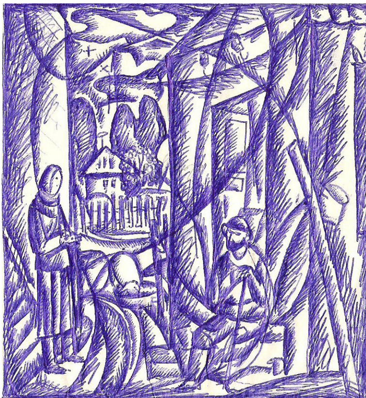
«Ожидание». 1980–83, б., ш. ручка

В наследии Казбека Хетагурова нет автопортретов. Но художник, пропускавший через себя внутреннее состояние своих героев, в каждом созданном им портрете оставил частицу своего «я». Портреты Казбека поражают особой достоверностью диалога модели и мастера, тонкой мастерской лепкой кистей рук, выразительностью лиц, сохранивших несомненное сходство портретируемых. Но все персонажи портретов имеют и нечто общее – тревожное, задумчивое или грустное настроение, открытый испытующий, вопрошающий взгляд, как на фотографиях Казбека.