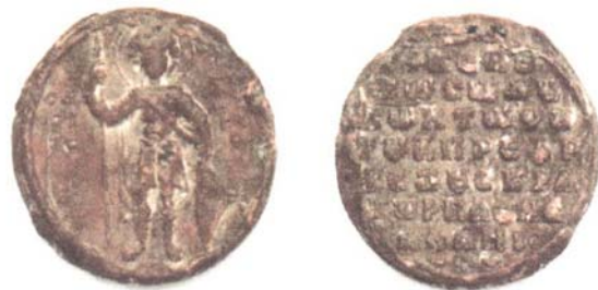
Илл. 3. Печать Константина, сына протопроедра и эксусиократора всей Алании (по: Аргун А.В. 2016)

Считают, что определения, подобные «эксусиократор всей Алании», были связаны с какими-либо экстраординарными событиями на территориях, требовавших не только постановки в управление ими энергичных функционеров, но и с расширением их полномочий, причем как в большем территориальном охвате, так и в привлечении широких административных и военных ресурсов [16, с. 169]. Однако такое решение в отношении аланского правителя [17, с. 723] не может быть принято, т. к. Византия не обладала никаким сюзеренитетом над Аланией, тем более чтобы назначать в ней правителей. Алания, в отличие от других кавказских государств, никогда не состояла в вассальной зависимости от Византии.