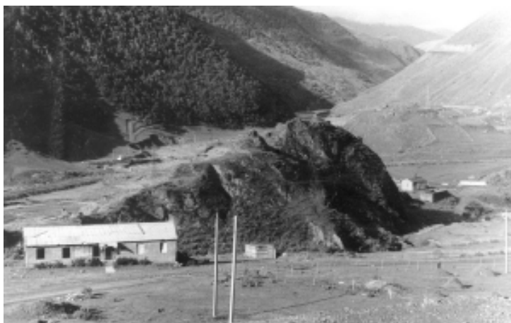
Рис.1. Наро-Мамисонская котловина. Общий вид, на переднем плане Зарамагский утес.

В ходе наших разведочных полевых работ 1974 г. на поверхности утеса, в частности на северо-западном склоне, была собрана небольшая серия мелких и сильно окатанных обломков керамики раннесредневекового (указать более точную дату затруднительно, фрагменты недостаточно выразительны) облика. Видимо, в раннем средневековье Зарамагский утес использовался как природное укрепление; можно полагать, что при последующих разысканиях будут обнаружены и более древние материалы. К более поздней эпохе явно относится сильно разрушенный галуан (замок) осетинской фамилии Магкаевых [3]. Судя по разной технике кладки на разных уровнях, галуан не раз перестраивался и ремонтировался. Время его активного функционирования можно отнести к XVII–XIX вв., хотя прямых аргументов для обоснования такой даты нет. К сожалению, весьма интересный в рамках нашей темы Зарамагский утес археологически почти не изучен.