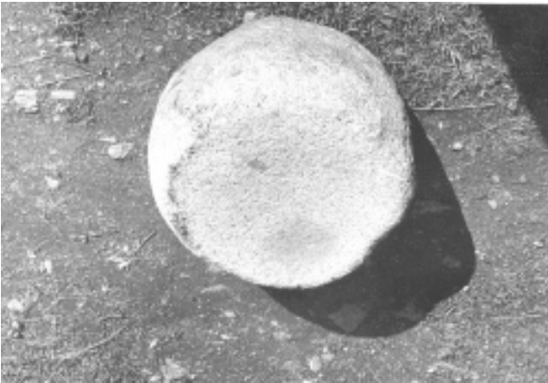
Рис 4. Каменная база для несущей деревянной конструкции из культурного слоя.