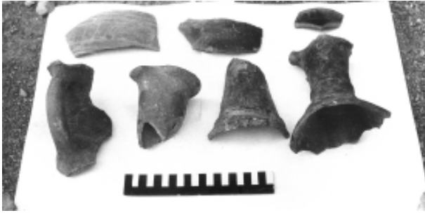
Рис. 7. Материал из культурного слоя КС - II. Фрагменты керамики.

кой вишневого цвета в юго-восточном углу камеры и здесь же три обрывка кожи от истлевшей обуви. Датировка погребения определяется серьгой, достаточно широко распространенной в горных могильниках Кавказа XVII–XVIII вв. (например, в склеповом могильнике «город мертвых» у с. Даргавс, [5, рис. 26, 1–2]). Серьги данного типа встречаются и в могилах Махческ с венецианским стеклянным сосудом XV в. [6, табл. СХП]; однако их синхронность остается неясной вследствие перемешанности материала.