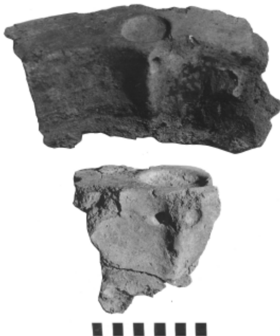
Рис 9. 1–2 – обломки очажной подставки. Случайная находка.

обломка 26,5 см, толщина 5,6 см. Верхний край подставки плоский, в нем круглое углубление диаметром 6,5 см, здесь же на внутренней стороне выступ с двумя симметрично расположенными вдавлениями (рис. 9, 1–2). Подставка опубликована С.Н. Корневым [18, рис. 1]. Она входит в круг уже известных подставок культового назначения, относящихся к куро-аракской культуре Закавказья эпохи ранней бронзы (3000–2700 гг. до н.э., пользуюсь любезной консультацией В.Л. Ростунова) и имевших полукруглую или подковообразную форму [19, табл. 13]. Очажные подставки куро-аракской культуры, но несколько иных форм, найдены в поселении Сержень-юрт в Чечне [20, рис. 9]. Таким образом, этот вид культовой керамики первой половины III тыс. до н.э. бытовал не только в Закавказье, но и на Северном Кавказе. Сейчас для нас существенно то, что в районе Цми – Наро-Мамисонской котловины есть следы культуры III тыс. до н.э., что свидетельствует как о заселенности котловины в это время, так и об использовании высокогорных перевалов и вероятных устойчивых связях между севером и югом Кавказа с глубокой древности. Городище Цми, очевидно, можно рассматривать как место постоянного обитания гарнизона, охранявшего Касарский оборонительный комплекс от опасности с севера и явно защищавшего в VII–IX вв. (может быть и позже) юг Кавказа. В XIV в., согласно