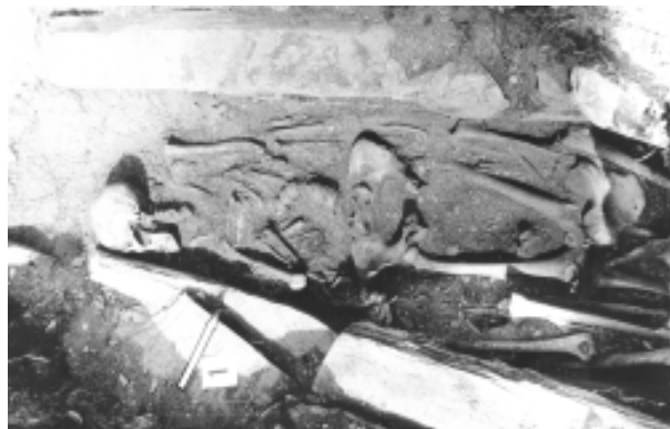
Рис. 6. Поздневековое погребение в каменном ящике, правый берег р. Цмидон.

Находки: у затылочных костей черепа бронзовая штампованная серьга «лопатообразной» формы и четыре подвижные (на колечках) подвески с шариками на концах, бронзовый наперсток, бронзовая пуговица – бубенчик, серебряный перстень с вставкой из прозрачного стекла у тазовых костей, бронзовый перстень с халцедоновой встав-