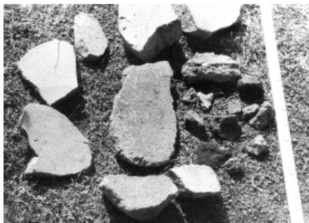
Рис 5. Материал из культурного слоя КС - II. Каменные зернотерки, обломок зернотерки.

сланцевого щебня, мощность этого слоя до 0,30 м. В шурфе найдено 13 мелких костей животных и несколько древесных угольков. Шурф доведен в глубину до 0,35 м и скального материка.