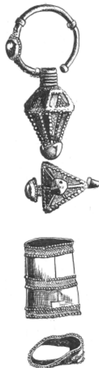
Рис 8. Трубчатый наконечник и золотое височное кольцо. Случайная находка.

Всего в нашей выборке керамики из КС-I и КС-II было выявлено 5 фрагментов перекаленной керамики, и все они относятся к третьей группе, что, возможно, свидетельствует о том, что посуда первой и второй групп на месте не производилась и была завезена с предгорной равнины, тогда как третья группа могла быть изготовлена на территории Двалетии и городища Цми. Кроме упомянутого гончарного брака, производство керамики на городище подтверждается и многочисленными лег-