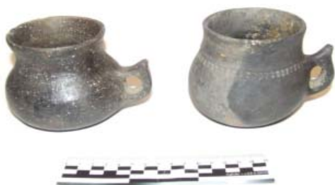
Илл. 11. Находки из катакомб (раскопки 2020 г.)

фортификационных сооружений этого грандиозного сооружения раннесредневековых алан.