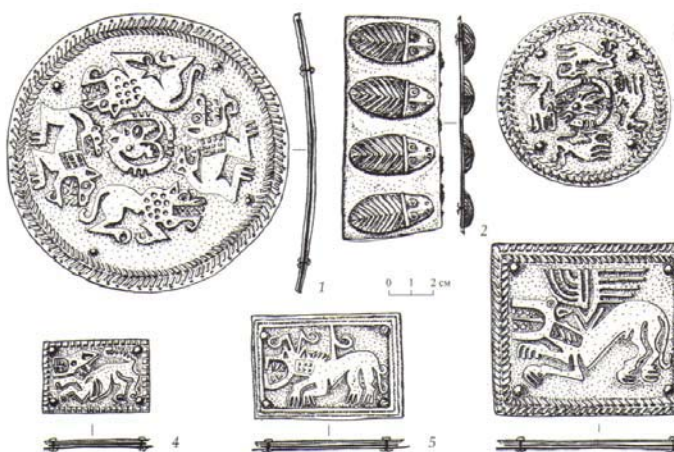
Илл. 9. Украшения сбруйного комплекса. Бесланский катакомбный могильник. Раскопки Ф.С. Дзуцева (раскопки 2020 г.)

и быть важным элементом перехода хозяина в потусторонний мир. Об этом свидетельствуют многочисленные данные как археологических, так и письменных источников о северо-иранских племенах древности и средневековья: киммерийцах, скифах, сарматах, аланах. До недавнего времени конь занимал важнейшее место как в повседневном быту и на войне, так и в погребальных обрядах осетин. В частности, это специальный обряд посвящения коня покойному хозяину – бæхфæлдисæн и обычай устраивания скачек в честь умершего мужчины-воина (дугъ). Еще одна характерная черта погребального обряда Бесланского катакомбного могильника, это укладывание в погребение частей туши барашка, как правило, ног.