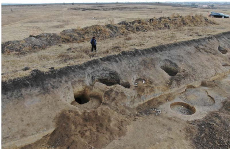
Илл. 5. Хозяйственные, зерновые ямы. Холм № 5 (раскопки 2020 г.)

делает справедливый вывод: «Перед нами типичный спектр домашних животных оседлых земледельцев и скотоводов, ведь со свиньями никто не кочует! Значит, аланы не были кочевниками...?» [8, с. 21]. В слоях Зилгинского городища встречаются, кроме того, кости верблюдов и благородного оленя, крупные кости