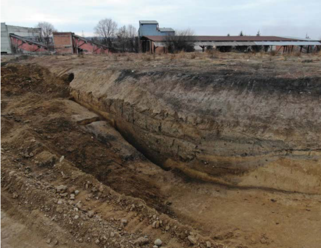
Илл. 3. Разрез оборонительного рва. Холм № 5 (раскопки 2020 г.)

памятник ранее 2020 г., зафиксировали здесь 4 глубоких рва, разделяющих жилые холмы и цитадель. Наши раскопки 2020 г. позволили выявить в южной части жилого холма № 5 еще один, пока пятый по счету, оборонительный ров, а также прояснить его достаточно простую конфигурацию. Линия борта рва спускалась под острым углом ко дну, перемежаясь в двух местах небольшими горизонтальными полками-площадками. Это свидетельствует о том, что древние мастера – строители укреплений городища были хорошо знакомы с принципами построения сложных фортификационных систем. Кроме того, обнаруженный недавно 5-й ров городища свидетельствует о том, что данный масштабный археологический памятник, который известен науке уже много десятилетий, скрывает еще много интересных «сюрпризов» и сулит большие научные перспективы при его дальнейшем исследовании.