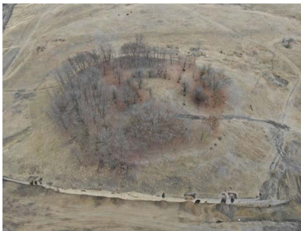
Илл. 2. Цитадель Зилгинского городища. Фото с квадрокоптера (раскопки 2020 г.)

как предполагается, городище омывалось водами реки, которую мы сегодня именуем Камбилеевкой. В последующие эпохи река «отступила» к северу, где и протекает в настоящее время. С юга к склонам городища, вероятно достаточно близко, подступала река Терек или один из ее рукавов. Близость этих водных артерий не только усиливала обороноспособность города, но служила, разумеется, в качестве доступного источника питьевой воды, а также воды, применявшейся для бытовых нужд. Большое количество воды требовалось также для обслуживания многочисленных ремесленных и обрабатывающих производств: выплавка цветного и черного металла, кузнечное дело, изготовление керамики и т. д. При этом ни предыдущими исследователями, ни нашими раскопками 2020 года колодцев на территории городища не зафиксировано. Что подтверждает предположение о снабжении города водой из Камбилеевки.