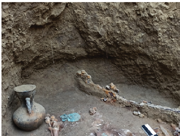
Илл. 8. Кувшин с зооморфной ручкой (раскопки 2020 г.)

хеологических исследований Зилгинского городища в конце 80-х гг. XX в. также связана с именем М.М. Блиева.