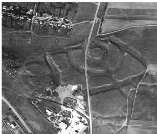
Илл. 1. Аэроснимок Зилгинского городища

Еще одним интересным и важным историко-культурным объектом Осетии-Иристана является Зилгинское раннесредневековое городище. Памятник является важным объектом культурного наследия федерального (всероссийского) значения. Городище поставлено на государственную охрану указом Президента Российской Федерации «Об утверждении Перечня объектов исторического и культурного наследия федерального значения» № 176 от 20.02.1995 г. Этот, по меркам эпохи средневековья, мегаполис является одним из самых крупных населенных пунктов аланской культуры Северного Кавказа раннего этапа.