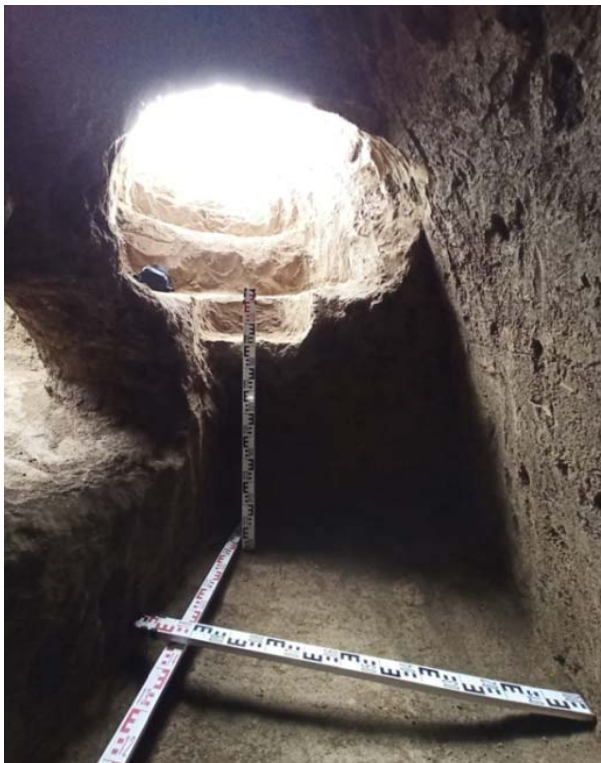
Илл. 7. Камера катакомбы (раскопки 2020 г.)

евой, полагает, что ряд групп аланского населения предгорно-равнинной части Центрального Кавказа в конце первой половины 1 тыс. н. э. передвинулись в горную зону региона. И, в частности, что Зилгинские (Бесланские) аланы ушли в горы современной РСО-А и положили начало таким памятникам, как Садонский катакомбный аланский могильник. «... Могильники Беслан, Брут 2 и, возможно, Паласа-Сырт являются предковыми для населения Садона» [8, с. 50] (выделено нами. – В. Ч.).