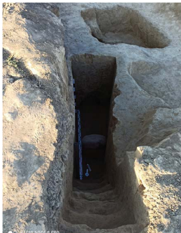
Илл. 10. Входная яма катакомбы со ступеньками (раскопки 2020 г.)

ликовые, гранатовые, стеклянные, фаянсовые бусы и подвески. Важное место в перечне погребального инвентаря могильника занимают предметы, связанные с упряжью верхового боевого коня. Это удила, псалии, декоративные накладки на уздечку, фалары, привески, колокольчики, нащечники и т. д. из бронзы, серебра, золота. Зачастую украшения коня превосходят своим богатством украшения хозяина. И это не случайно. Конь должен был служить аланскому воину не только в этом мире, но и сопровождать его