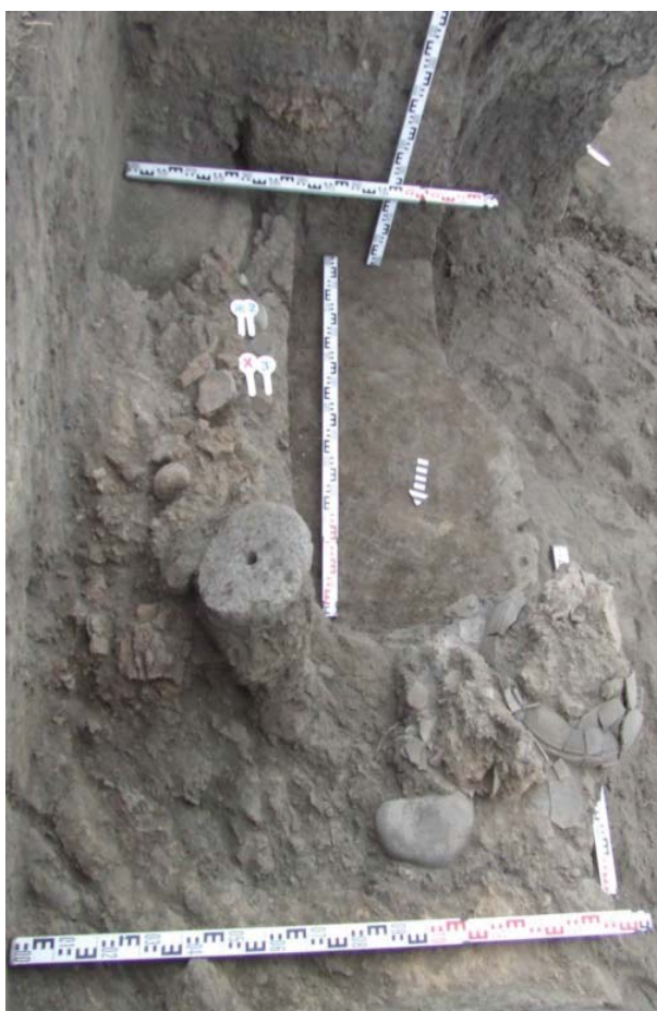
Илл. 6. Жилище. Холм № 3 (раскопки 2020 г.)

делает справедливый вывод: «Перед нами типичный спектр домашних животных оседлых земледельцев и скотоводов, ведь со свиньями никто не кочует! Значит, аланы не были кочевниками...?» [8, с. 21]. В слоях Зилгинского городища встречаются, кроме того, кости верблюдов и благородного оленя, крупные кости