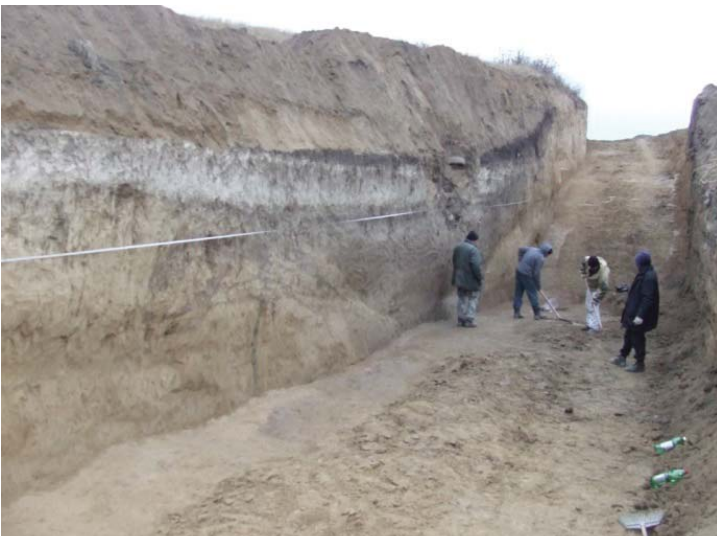
Илл. 4. Ров № 4 (раскопки 2020 г.)

Холм № 5 является и наиболее крупной частью всего городища. Только в ходе наших раскопок на нем было выявлено и исследовано около 150 жилых и