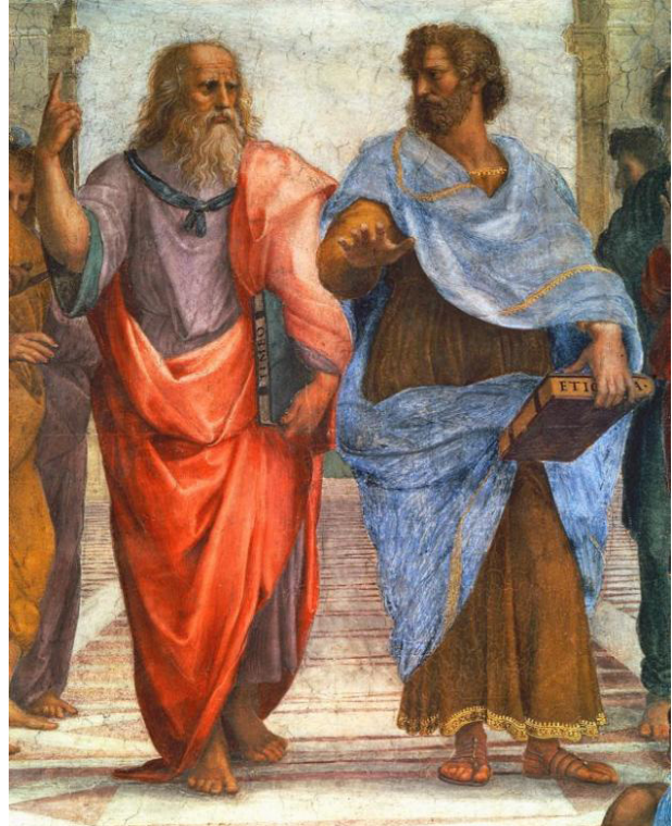
Платон и Аристотель. Фрагмент фрески Рафаэля «Афинская школа». Ватикан

В греческой философии понятие космоса стало использоваться с 6 в. до н. э. для выражения присущей миру гармонии единства и множественности. У Анаксимандра он еще обозначал не Вселенную, а ее части в виде неких концентрических элементов (κόσμοι) внутри сферического мира-небосвода (οὐρανός), но уже Анаксимен применял термин «космос» для обозначения всего мира. По другой версии, первым философом, назвавшим универсум «космосом, по порядку (τάξις), который ему