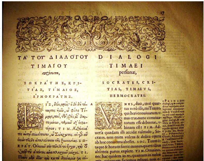
Первая страница диалога Платона «Тимей», посвященного вопросам космогенеза (изд. Н. Stephanus, Париж, 1578)

ся космический огонь (Гестия), вокруг которого вращаются космические тела: Земля, планеты, и Солнце. Аристарх Самосский (3 в. до н. э.) высказал идею гелиоцентрической системы.