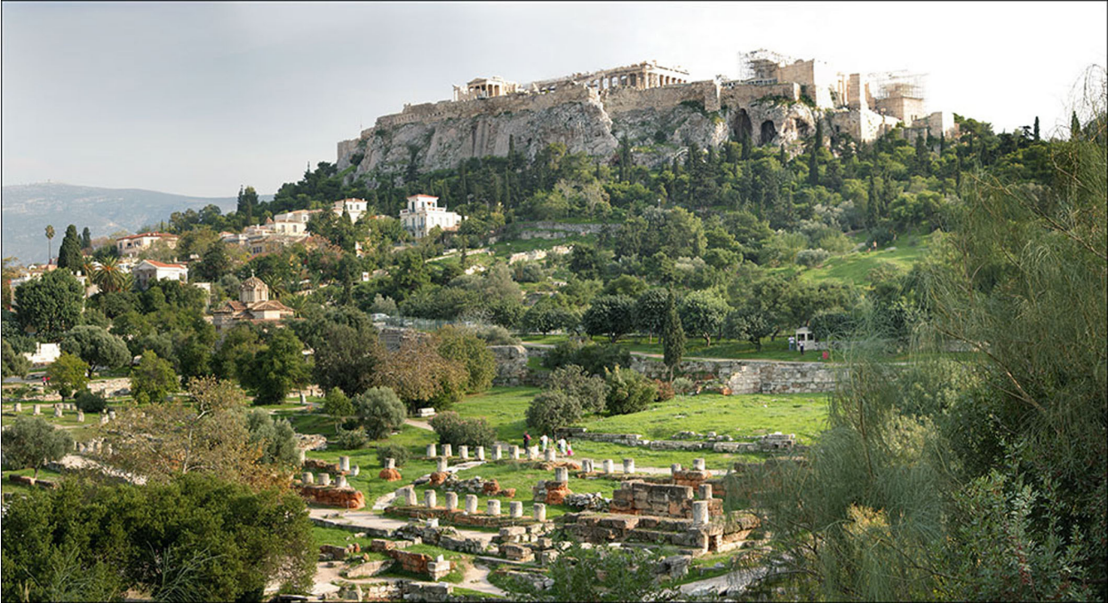
Афинская agora (место для народных собраний) у подножья акрополя. Современный вид

до н. э. при ее лидере Перикле. Экклесия теоретически охватывала всех полноправных граждан и решала основные вопросы государственной жизни: принятие законов, вопросы войны и мира, бюджет, вотирование декретов, внешнюю и внутреннюю политику, управление полисом, преступления против государства, вопросы апелляции. Решения принимались общим голосованием.