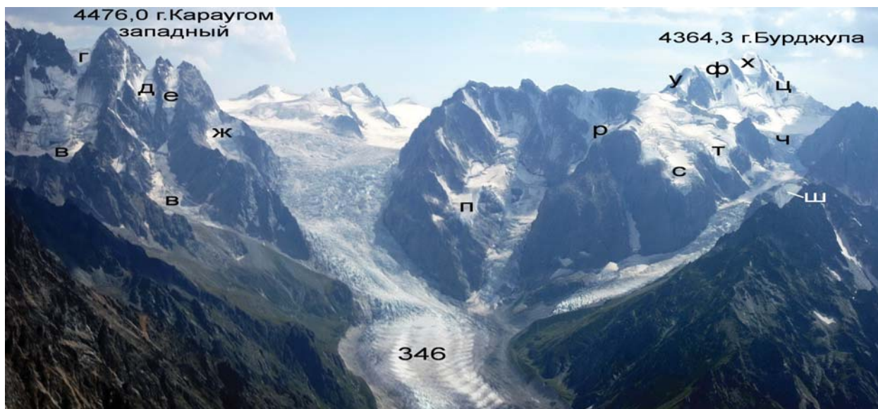
Фото 5. Отчленившиеся ледники на северных склонах Караугома. Аэрофотопанорама Р. Тавасиева, 2006 г.

не перегружать фотографии и карту, ледники на них обозначены только буквенными индексами (фото 5–9, рисунок 1).