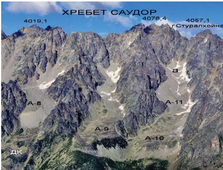
Фото 9. Ледник и каменные глетчеры под Саудорским хребтом. Фрагмент фото М. Голубева 2008 г.

западный, может произойти отчленение висячих частей ледника №346 в Гулари-цете и преобразование их в отдельные висячие ледники.