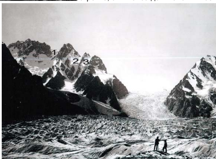
Фото 3. Ледник Караугом в 1890 г.

51 в таблице 1 дан № 346 с индексом «д». Ледник на схеме № 52 остался в таблице 1 под этим же номером. На схеме номера ледников с 18 по 24 в бассейне Караугома даны в квадратных скобках. Но ледникам 19, 20, 21 и 22 в таблице 27 присвоены номера 346а, 346б, 346в и 346е. А ледникам под номерами 18, 23 и 24 в таблице 27 номера не даны [4, с. 23, 28, 38]. Индекс «г» в нумерации этих ледников пропущен. Поэтому всем отчленившимся ледникам бассейна ледника Караугом мы присвоили № 346 с буквенным индексом по алфавиту, в порядке с востока на запад по часовой стрелке, от № 346а до № 346ш. Чтобы