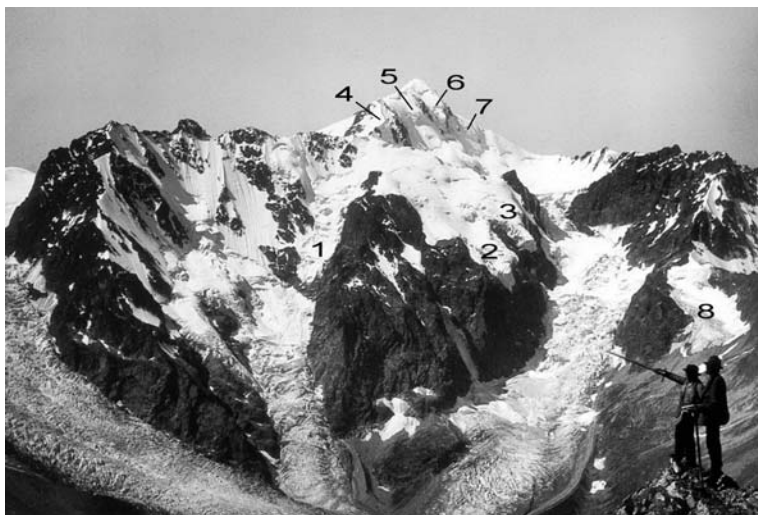
Фото 2. Ледники северного склона г. Бурджула в 1890 г.