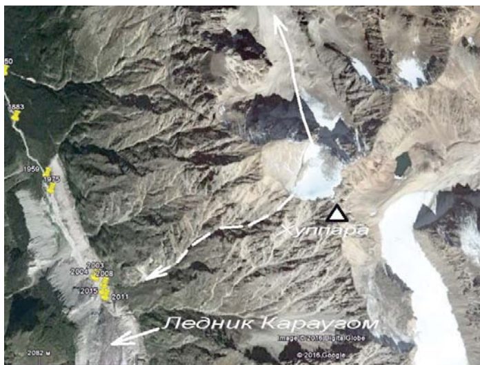
Фото 1. Верхняя отчленившаяся часть ледника Цадоти-цете. Пунктирной стрелкой показан ошибочный предполагаемый сток, сплошной – настоящий сток этого ледника.

На фотографиях известного итальянского альпиниста Витторио Селлы 1890 года видно, что уже тогда над левыми притоками ледника Караугом было 8 отдельных ледников (фото 2). Над правым притоком Караугома, кроме двух ледников, которые отчленились к 1883 г. [6, 8, 11, карты], было еще 3 ледника (фото 3). На фотографии, сделанной Витторио Селлой со стороны Сванетии, изображена гора Бурджула на фоне горы Уилпата. На этой фотографии отчетливо виден висячий ледник на горе Уилпата, нависающий над Караугомским плато (фото 4). Итого, по картам нескольких авторов [6, 8, 11, карты] и фотографиям Витторио Селлы видно, что в бассейне самого ледника Ка-