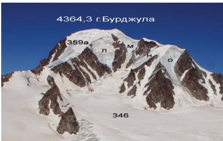
Фото 7. Ледники южного склона г. Бурджула. Фрагмент фото А. Зотова 2008 г. (Ледник 359а, Сванетия, Грузия)

4 084,0 г. Ногкау-Сахзайне, вливается в Караугом под поверхностной мореной. В ближайшие годы может произойти его отчленение. Если произойдет отчленение этого притока, а ледник № 346в снова не станет притоком, то ледник Караугом будет уже не сложный долинный, а простой долинный.