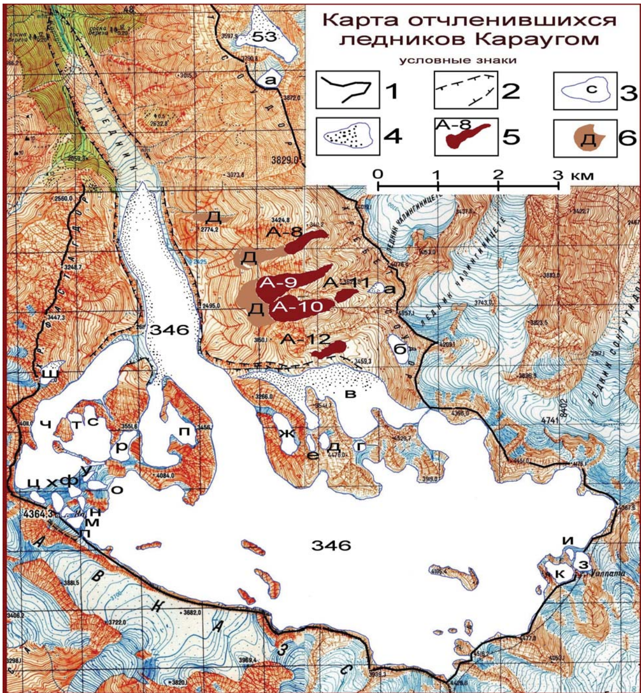
Рис. 1. Карта отчленившихся притоков ледника Караугом. Условные знаки: 1 – хребты, ограничивающие бассейн ледника Караугом; 2 – береговые морены; 3 – ледники и их номера; 4 – части ледников, покрытые поверхностной мореной; 5 – активные каменные глетчеры и их номера; 6 – древние не активные каменные глетчеры

Последний оставшийся приток ледника Караугом, который начинается в каре под вершиной