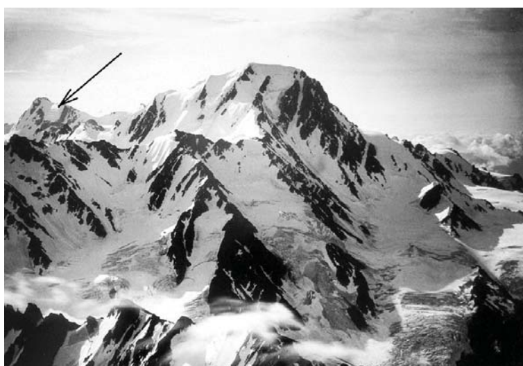
Фото 4. Гора Бурджула со стороны Сванетии (Грузия). Фото В. Селлы 1890 г. На заднем плане г. Уилпата с висячим ледником (показано стрелкой)