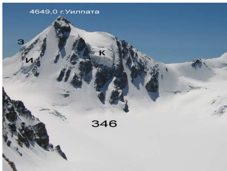
Фото 8. Караугомское ледниковое плато (346) и висячие ледники на г. Уилпата.

береговой мореной ледника № 346в Гулари-цете под «мертвыми» льдами отступившего ледника № 346б (фото 6). В плане этот глетчер имеет сужающуюся зигзагообразную форму. Левым краем он частично разрушил правую береговую морену ледника № 346в.