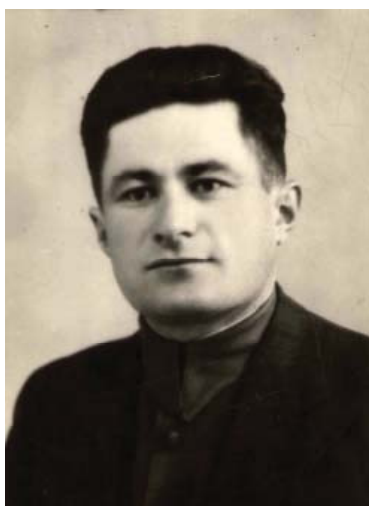
КУСРАЕВ Георгий Бероевич