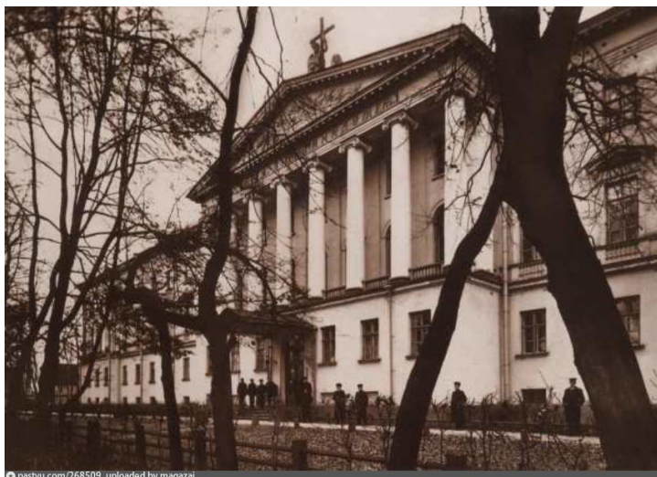
Санкт-Петербургская духовная академия