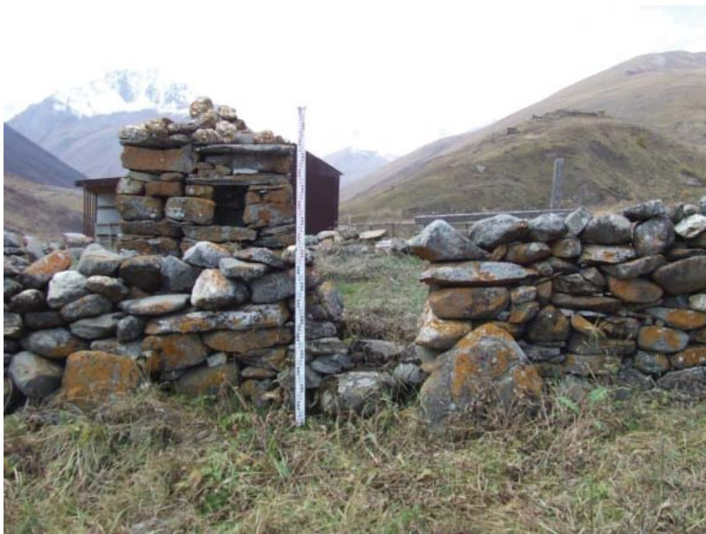
Рис. 5. Селение Камсхо. Святилище Дамбадели / Мады Майрæм

Таким образом, архитектурно оба святилища, и в Урсдоне и в Лисри, совершенно разные. Говоря об Урсдонском святилище Мигъдау , нельзя обойти