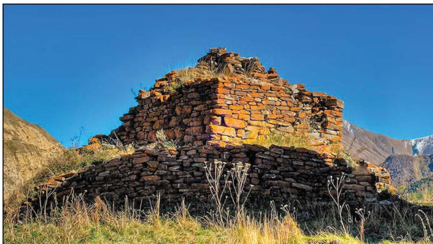
Рис. 2. Святилище Мидхъæу дзуар в селении Лисри

находятся черепа животных. Третий ярус сооружения представляет собой четырехугольный в плане с размерами 1,30 x 1,60 м сегмент, высотой 1,80 м. В западной части его устроены две ниши в кладке, одна над другой. По свидетельству В.Х. Тменова, святилище венчали ранее белые камни – куски кварцита [10, с. 152], в настоящее время они почти все утрачены – вероятно, скатились вниз, в результате дождей и снегопадов, или были разобраны туристами на сувениры. Очевидно, из-за особенностей формы святилища, представляющего собой