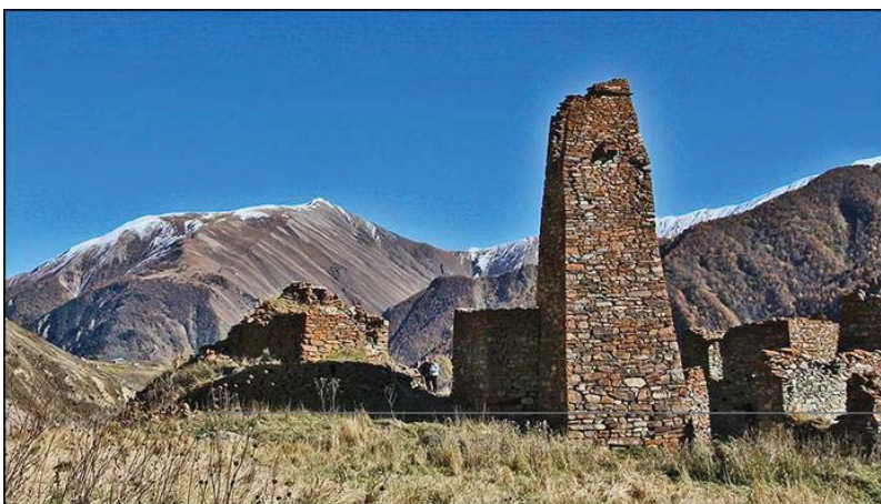
Рис. 1. Святылище Мидхъæу дзуар в селении Лисри (слева) и башня фамилии Дарчиевых

Святылище Мидхъæу дзуар в с. Лисри примечательно особенностями своей сохранившейся архитектуры, отличающей его не только от остальных культовых памятников Мамисонского ущелья, но, пожалуй, и всей Осетии. Дзуар представляет собой трехъярусное, достаточно крупное сооружение, сложенное методом «сухой кладки» из разноразмерных камней, порою весьма крупных. Нижний ярус устроен в виде несколько приближенной к овалу в плане площадки (7,90 x 8,90 м), составляющей в высоту 1,80 м. По мнению В.Х. Тменова, вероятно, при ее сооружении была использована естественная возвышенность, обнесенная массивной подпорной стеной. Северный сектор этой платформы с примыкавшей, возможно, к ней лестницей, разрушен [10, с. 152]. Второй ярус дзуара представляет собой прямоугольное в плане сооружение длиной 5,90 и шириной 4,85 м. Высота второго яруса 2,20 м. В западной стене сооружения на высоте 1,55 устроена каменная ниша (0,70 x 0,45 x 0,75), перекрытая массивной каменной плитой. Внутри ниши