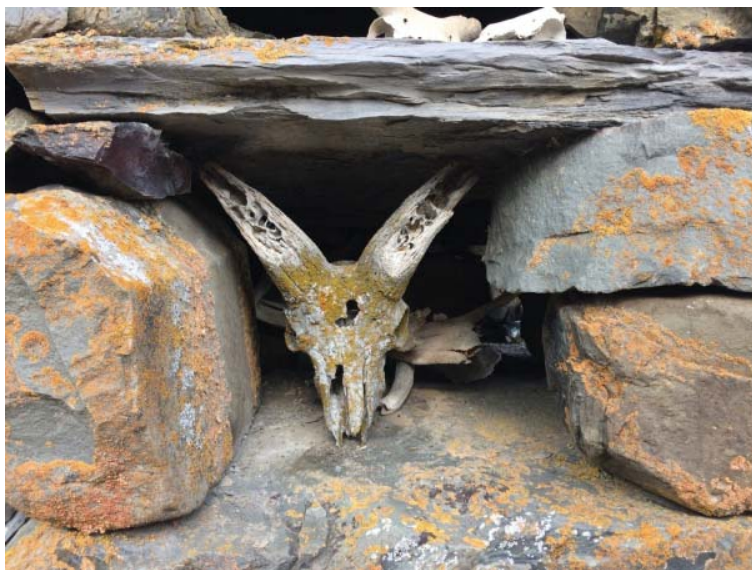
Рис. 6. Святилище Дамбадели / Мады Майрæм. Приношения в нишах

Мигъдау дзуар является не часовней, а церковью» [4]. Обратившись к определению этимологии слова «Мигъдау», М.И. Мамиев отмечает: «Е.Г. Пчелина писала следующее: «Название этого святилища состоит из двух слов: Мигъ – туман и дау, которое может являться сокращением от слова дауге – светлый дух от слова «дау» – подозрение, клятва. В обоих значениях этого слова название это соответствует народному представлению о функциях этого святилища. С одной стороны, святилище Михдау является патроном благоприятной для земледелия и плодородия трав погоды и, во-вторых, здесь давались клятвы при совершении судопроизводства по обычному праву». Перевод слова «дау», конечно же, неверен. Его некоторая фантазийность является, видимо, попыткой объяснить причину специального выбора места для клятвы в ходе судебных разбирательств на поляне Мадизæн . Отождествляя дзуар Мигъдау с патроном хорошей погоды, Е.Г. Пчелина первая из исследователей перевела его образ в понятную рациональную религиозно-практическую плоскость» [4]. Как справедливо подчеркивает далее М.Э. Мамиев, «в осетинском пантеоне специальный патрон туч отсутствует... Кроме того, сам термин божество предполагает наличие политеизма, который, как известно, отсутствовал в средневековой монотеистической Осетии.