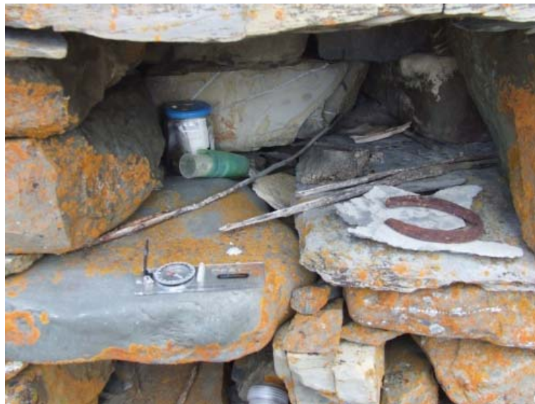
Рис. 7. Святилище Дамбадели / Мады Майрæм . Приношения в нишах

В свете рассматриваемой нами темы нельзя не вспомнить о святилище Дамбадели / Мады Майрæм , расположенном рядом с с. Лисри, на южной окраине с. Камсхо (рис. 5–7). Дзуар находится в квартале фамилии Рамоновых, на левом берегу р. Мамисондон. Памятник представляет собой столпообразное сооружение квадратной в плане формы, сложенное из разноразмерных камней, «сухой кладкой», с пирамидальной вершиной [10, с. 146]. Святилище обнесено невысокой каменной стеной, прямоугольной в плане формы, выполненной также методом «сухой кладки». Внутри ограды, между последней и святилищем, размещены уплощенные камни и длинные доски, которые служат во время годового праздника столом и стульями для молящихся. Святилище смещено к южной части ограды,