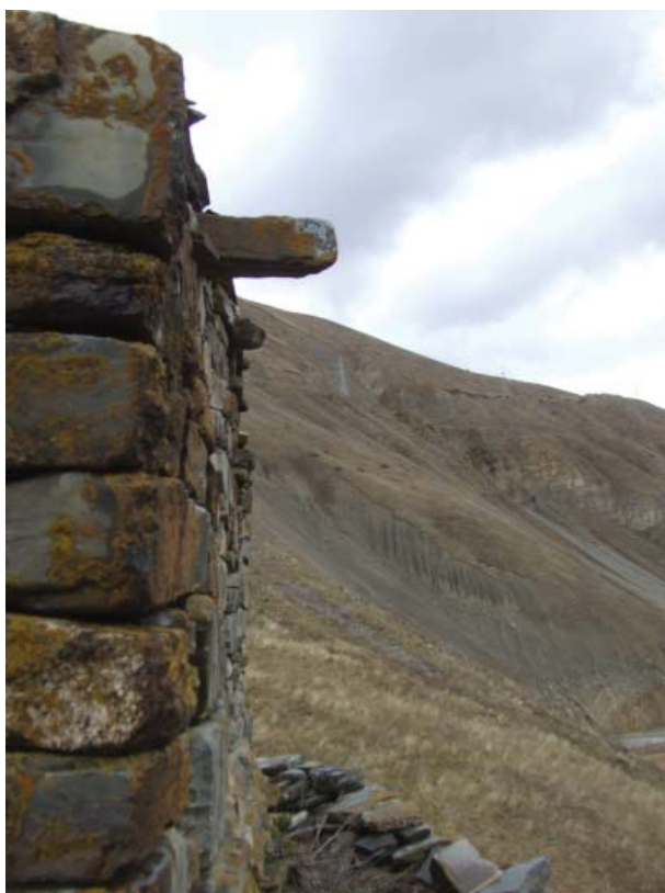
Рис. 3. Выступающая каменная плита в верхней части восточной стены святилища Мидхъæу в с. Лисри

находятся черепа животных. Третий ярус сооружения представляет собой четырехугольный в плане с размерами 1,30 x 1,60 м сегмент, высотой 1,80 м. В западной части его устроены две ниши в кладке, одна над другой. По свидетельству В.Х. Тменова, святилище венчали ранее белые камни – куски кварцита [10, с. 152], в настоящее время они почти все утрачены – вероятно, скатились вниз, в результате дождей и снегопадов, или были разобраны туристами на сувениры. Очевидно, из-за особенностей формы святилища, представляющего собой