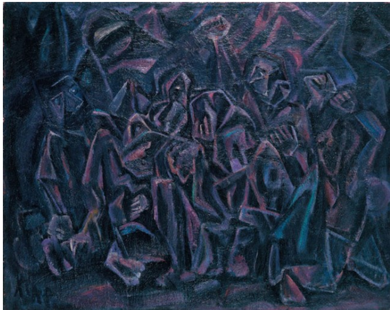
Расстрел репрессированных (1983)

По вышеперечисленным произведениям можно судить о художественной манере Х. Гассиева: язык его предельно лаконичен, графичен, мону-