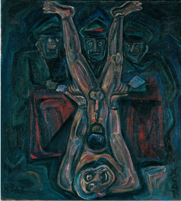
Признание. 1937 год (1983)

тическим событиям середины 30-х годов XX столетия, можно поделить на два цикла.