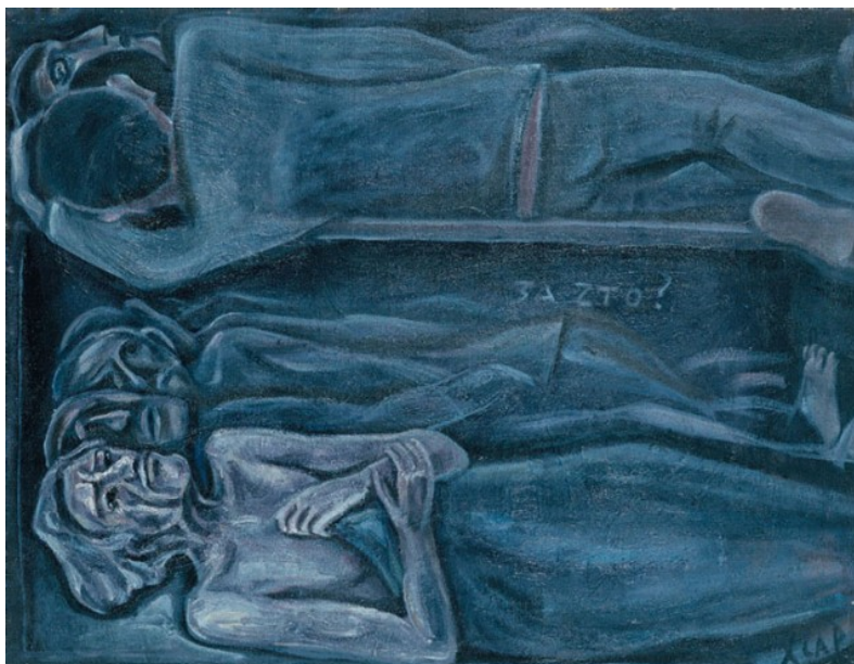
За что? (1982)

ментален, словно он вырубает своих персонажей в камне. Отсюда и четкость контурных линий, скупой колорит, но при этом экспрессивность и динамичность повествования, которые передают трагедию происходящего.