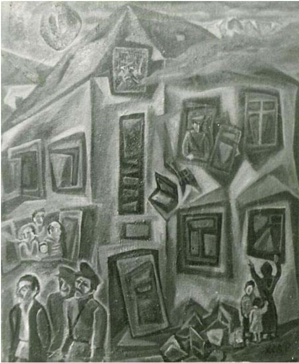
Изгнание из дома (1980-е)

ские отношения: добро, понимание, сострадание и взаимопомощь.