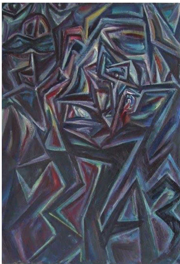
37-й год (2003)

военное пятилетие очень большая часть приходится на долю казненных» [12, с. 129]. Д.А. Волкогонов назвал Сталина главным виновником репрессий. По его данным, только в 1937–1938 гг. подверглись арестам 4,5–5,5 млн человек, из них расстреляно 800–900 тыс. Согласно историку В.Н. Земскову, «существует большое количество документов, в том числе опубликованных, где отчетливо видна инициативная роль Сталина в репрессивной политике. Взять, к примеру, его речь на февральско-мартовском Пленуме ЦК ВКП(б) 1937 г., после которого начался Большой террор. В этой речи Сталин сказал, что страна оказалась в крайне опасном положении из-за происков саботажников, шпионов, диверсантов, а также тех, кто искусственно порождает трудности, создает большое число недовольных и раздраженных. Досталось и руководящим кадрам, которые, по словам Сталина, пребывают в самодовольстве и утратили способность распознавать истинное лицо врага. Для нас совершенно ясно, что эти заявления Сталина на февральско-мартовском Пленуме 1937 г., – это и есть призыв к Большому террору, и он, Сталин, его главный инициатор и вдохновитель» [13]. Вождь считал себя последователем Ленина, а значит, и приверженцем теории революционного преобразования мира.