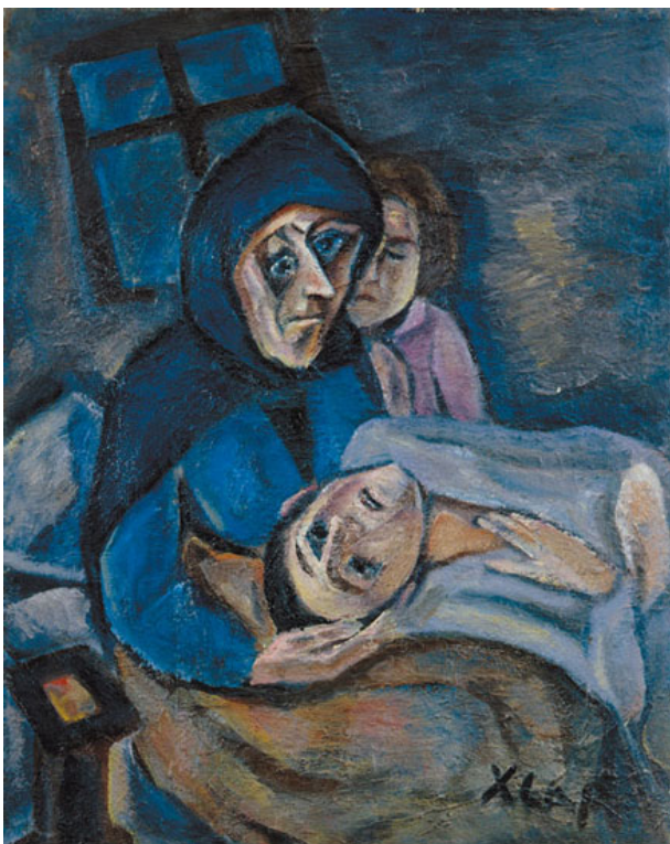
Мальчик болеет (1991)

военное пятилетие очень большая часть приходится на долю казненных» [12, с. 129]. Д.А. Волкогонов назвал Сталина главным виновником репрессий. По его данным, только в 1937–1938 гг. подверглись арестам 4,5–5,5 млн человек, из них расстреляно 800–900 тыс. Согласно историку В.Н. Земскову, «существует большое количество документов, в том числе опубликованных, где отчетливо видна инициативная роль Сталина в репрессивной политике. Взять, к примеру, его речь на февральско-мартовском Пленуме ЦК ВКП(б) 1937 г., после которого начался Большой террор. В этой речи Сталин сказал, что страна оказалась в крайне опасном положении из-за происков саботажников, шпионов, диверсантов, а также тех, кто искусственно порождает трудности, создает большое число недовольных и раздраженных. Досталось и руководящим кадрам, которые, по словам Сталина, пребывают в самодовольстве и утратили способность распознавать истинное лицо врага. Для нас совершенно ясно, что эти заявления Сталина на февральско-мартовском Пленуме 1937 г., – это и есть призыв к Большому террору, и он, Сталин, его главный инициатор и вдохновитель» [13]. Вождь считал себя последователем Ленина, а значит, и приверженцем теории революционного преобразования мира.