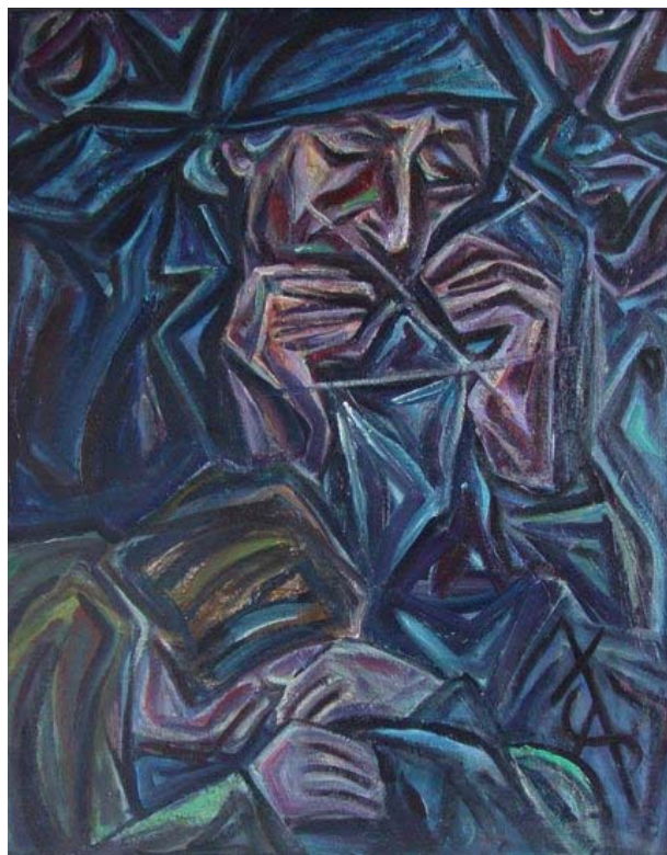
Воспоминание. Бабушка вяжет (2003)