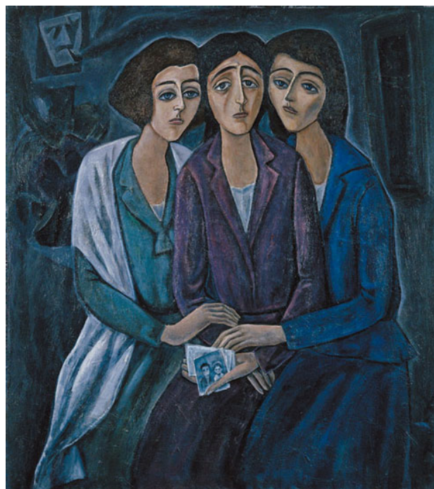
Подруги дней суровых (1987)

В изображении персонажей картины, в их образе, одежде, прическе, женственных мягких руках нет намека на то, что перед нами заключенные. Они одеты в простые гражданские платья. Автор словно отказывается признавать их арестантами. Лиричные образы иницируют простые челове-