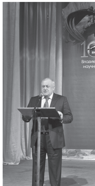
Глава Республики Северная Осетия-Алания Таймураз Дзамбекович Мамсуров

Глава Республики Северная Осетия-Алания Таймураз Дзамбекович Мамсуров тепло приветствовал собравшихся и подчеркнул важнейшую роль Владикавказского научного центра в развитии научно-технического потенциала республики. Готовность Президиума