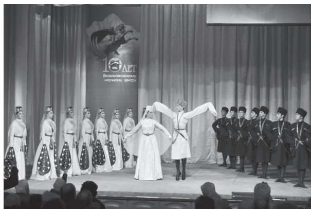
Танцует Государственный академический ансамбль народного танца «Алан»