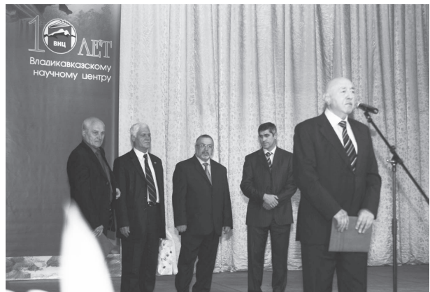
Поздравляют руководители вузов республики