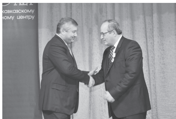
Президент Республики Южная Осетия Эдуард Джабеевич Кокойты вручает орден Дружбы РЮО председателю ВНЦ РАН и РСО-А А.Г. Кусраеву