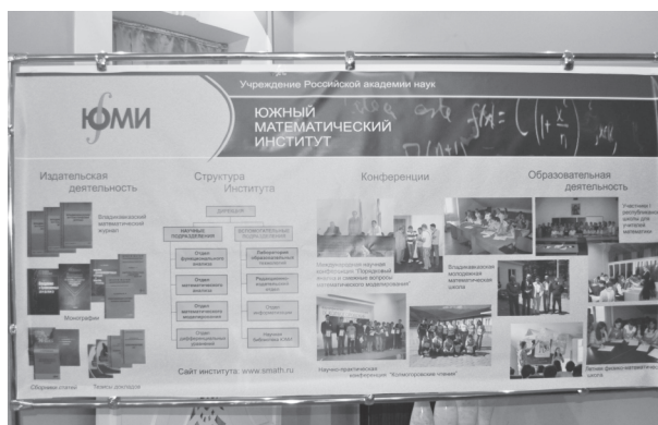
Выставка достижений ВНЦ, развернутая в вестибюле Русского драмтеатра