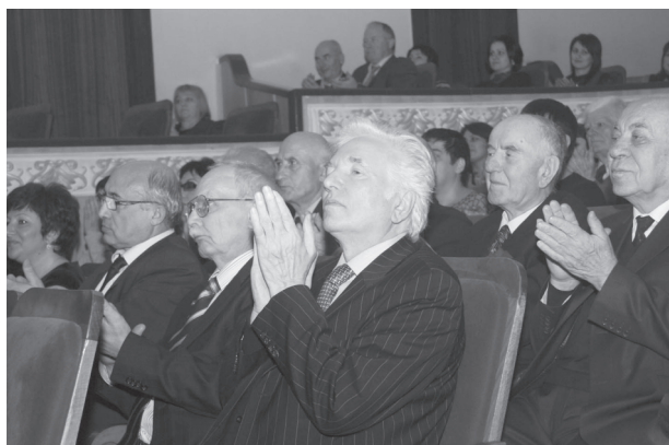
Гости торжественной церемонии чествования ВНЦ