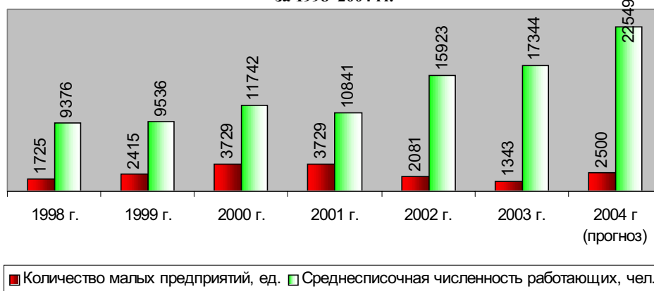
Диаграмма № 2.

ный характер, базирующиеся на региональных программах по приоритетным направлениям предпринимательской деятельности.