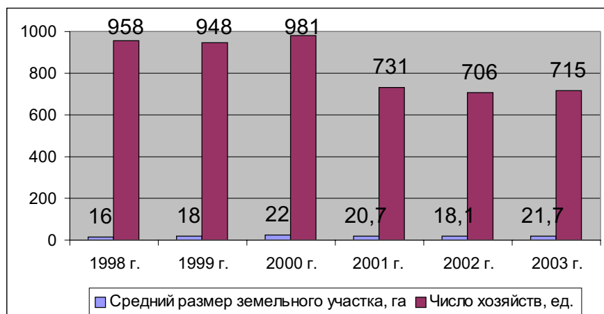
Крестьянские (фермерские) хозяйства РСО-А (по данным Государственного комитета по статистике РСО-А).

Примечание: физические лица, занимающиеся предпринимательской деятельностью без регистрации юридического лица, не учитываются в утвержденных федеральных формах статистической отчетности.