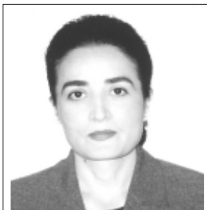
Зам. министра промышленности РСО-А А.Т. Цориева