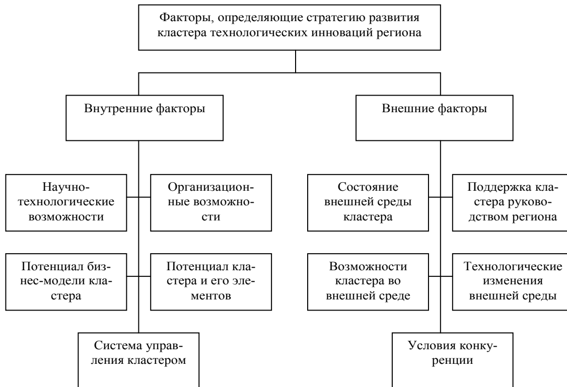
Рис. 3. Факторы, определяющие стратегию развития кластера технологических инноваций региона

Представляется, что развитие кластеров должно опираться на единую нормативную базу, позволяющую их сторонам и участникам, органам власти и бизнесу взаимодействовать в рамках ясного и единого правового поля с учетом взаимных интересов. Принятие такого закона может стать положительным сигналом для частных и иностранных инвесторов о прозрачности действий и привлекательности кластерного образования, о снижении рисков, связанных с обязательствами партнера именно в лице государства [9; 10].