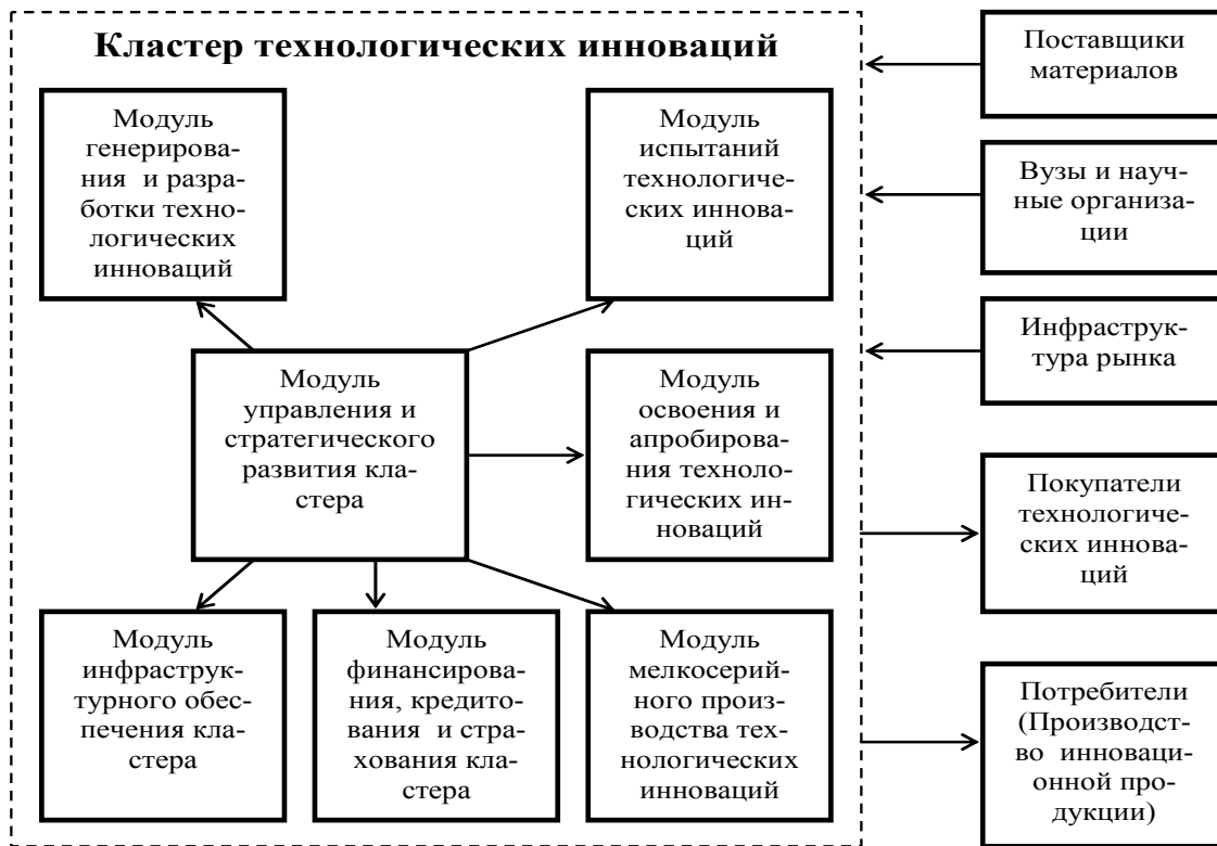
Рис. 1. Модульная структура кластера технологических инноваций

лых инновационных предприятий, коммерциализирующих результаты научных исследований, открытий и изобретений научных организаций;