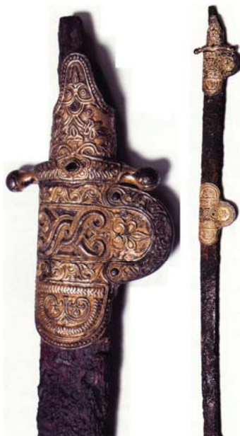
Рис. 4. Сабля из катакомб Змейского могильника (раскопки Е.И. Крупнова и В.А. Кузнецова, 1957 г.)

Таким образом, материальная культура Верхнего Джулата/Татартупа, архитектурные сооружения, масштабы застройки, богатство и обширность сопутствующего ему некрополя свидетельствуют о том, что здесь, у северного входа в «Эльхотовские ворота» находился один из крупнейших, если не наиболее крупный, городской и культовый центр Восточной Алании, население которого составляли не только многочисленные рядовые жители, ремесленники и воины, но и представители высших кругов элиты средневековой Алании.