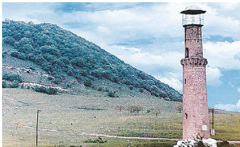
Рис. 1. Вид на Татартупский минарет и «Эльхотовские ворота»

крупным торговым и военно-стратегическим населенным пунктом, известным далеко за пределами собственно Алании XII–XIII вв. И это не было волею случая. Верхний Джулат/Татартуп, как отмечалось выше, не только расположен в географически очень перспективном месте, на трассе одного из транскавказских торгово-стратегических трактов, но и в богатом природными ресурсами, угодьями месте. Эта местность в прошлом также имела название «Урочище Татартуп» и второе наименование – Бекхан. Название «Бекхан», которое сохранилось в местной микропонимии, происходит от контаминации двух восточных феодальных титулов «бек» и «хан», которые указывали на особую роль данной местности в феодальную эпоху, скорее всего при Золотой Орде, в XIII–XV вв. Татартуп широко представлен в осетинском нартовском эпосе, фольклоре, традиционной религии осетин. На горе над Татартупом располагалось крупное и почитаемое святилище, на которое перешло название города. Татартупом клялись и осетины, и кабардинцы, и другие горцы Северного Кавказа. О военно-стратегическом положении Джулата/Та-