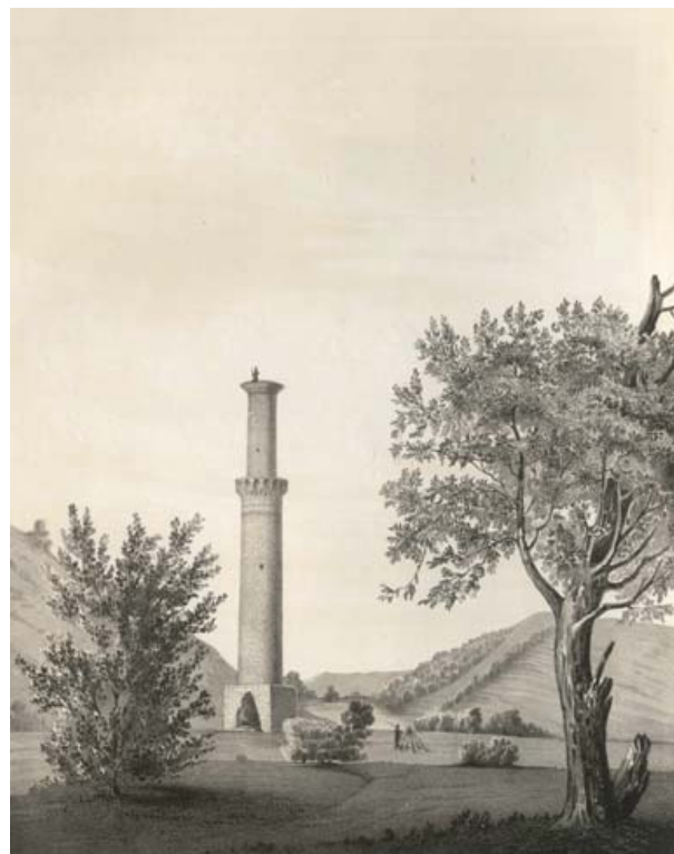
Рис. 2. «Минарет в 43 верстах от Владикавказа» (по Ф. Дюбуа де Монпере, 1840)

Добавим, что В.А. Кузнецов полагает, что ранние слои Джулата/Тартупа древнее X–XII века и эпохи Золотой Орды. По мнению ученого, они могут датироваться IV–V веками новой эры. «...Вполне можно констатировать наличие в «Эльхотовских воротах» древностей эпохи «великого переселения народов» [15, с. 20]. Исследователь некрополя