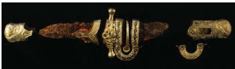
Рис. 5. Сабля из катакомб Змейского могильника (раскопки Р.Ф. Фидарова, 1997 г.)