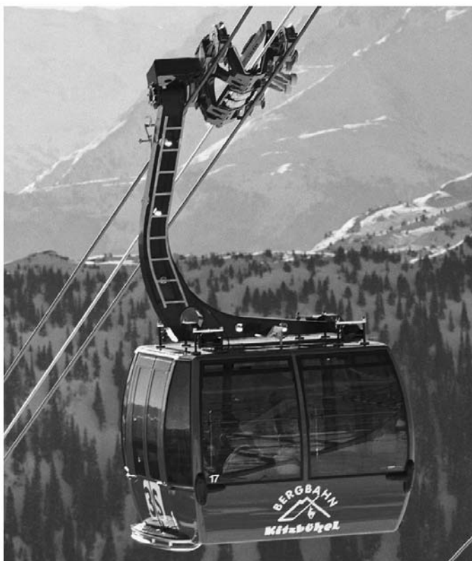
Рис. 5. Общий вид подвижного состава (кабины) трехканатной дороги

– эксплуатация и техническое обслуживание канатной дороги будет осуществляться высококвалифицированными кадрами, имеющими опыт и навыки в проведении регламентных работ, в том числе по вопросам спасения и эвакуации пассажиров.