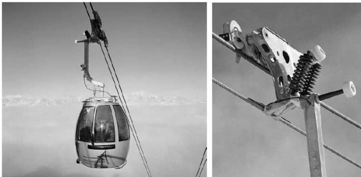
Рис. 7. Двухканатная дорога с одним несущим и одним тяговым канатами

водопадами, загадочные дольмены и древние жертвенные камни, уникальная роща пробкового дуба.