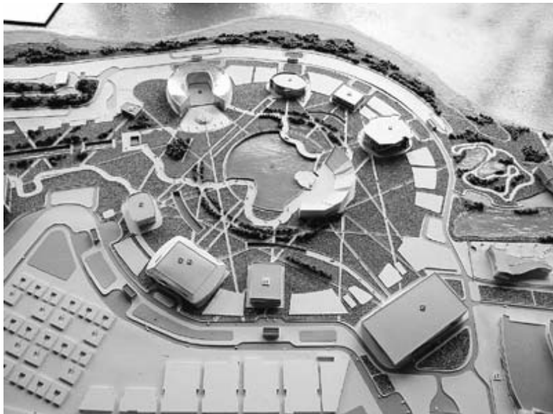
Рис. 2. Олимпийский парк в Имеретинской низменности

Разработанная транспортно-логистическая концепция перевозки пассажиров должна связать Олимпийский парк (включающий: большую ледовую арену – хоккей, 12 000 зрителей; малую ледовую арену – хоккей, 7 000 зрителей; конькобежный центр – конькобежный спорт, 8 000 зрителей; ледовый дворец спорта – фигурное катание; шорт-трек, 12 000 зрителей; арену для керлинга – керлинг, 3 000 зрителей; олимпийский стадион; главную олимпийскую деревню; медиа-центр; гостиницу членов МОК) с Красной Поляной (где будут расположены: санно-бобслейная трасса – бобслей, скелетон, санный спорт, 11 000 зрителей; комплекс «Хребет Псехако» – биатлон,