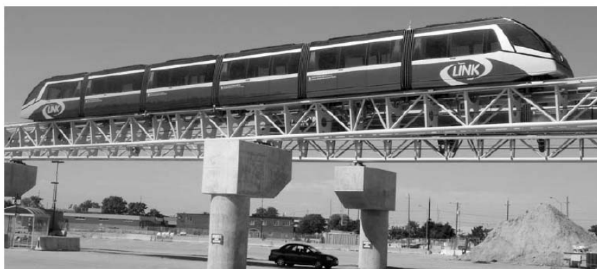
Рис. 6. Общий вид монорельсовой дороги с канатной тягой

В Хосте множество достопримечательностей: это единственная в мире уникальная тисосамшитовая роща, развалины византийской крепости, красивейший в Сочи каньон Навалишенский, знаменитые на весь мир Воронцовские пещеры – стоянка первобытных людей, единственная в своем роде 30-метровая смотровая башня на самой высокой прибрежной горе Ахун, поражающие всякое воображение Агурские водопады и Орлиные скалы, неисследованные до конца Назаровские пещеры с подземными реками, озерами и