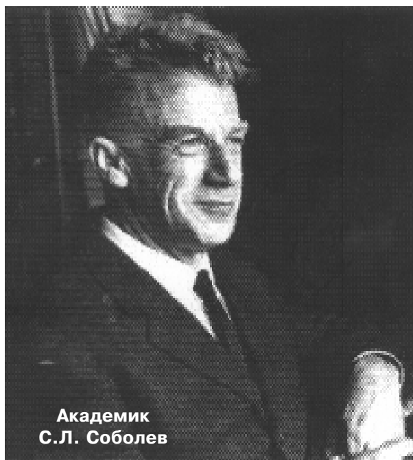
Академик С.Л. Соболев

Особо стоит выделить важную роль в становлении кибернетики и других новых направлений